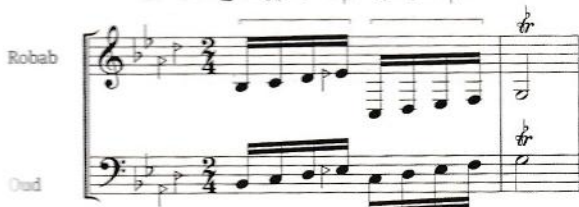
هم‌صدا با عود هم‌صدا با تار و ستور

۵. هرچند وسعت صوتی ریاب شبیه به تار است (در قسمت بم)، اما با توجه به رنگ صوتی اش (تیر) بیشتر با عود همراهی می‌کند؛ بنابراین یا به صورت اکتاو یا به صورت هم‌صدا (در محدوده‌ی زیرتر عود) خط عود را دوپل می‌کند. در ابتدا خط عود و ریاب مشترکاً با کلید \text{C} نت‌نویسی شده بود، ولی در ادامه، خطی جداگانه با کلید \text{G} به ریاب اختصاص داده شد.