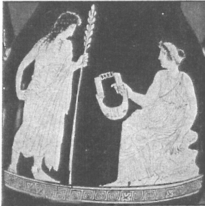
آپولون فرزند زئوس خدای نور و موسیقی

با نگاه به خدایان گوناگون در یونان همچون زئوس که خدای آسمان و رب النوع بشر بود، آپولون فرزند زئوس که رب النوع خورشید و نور و موسیقی بود که گاه او را چون کماندار و گاه نوازنده می‌پنداشتند می‌توان دریافت که موسیقی در این سرزمین بسیار ارزشمند بوده است. یونانیان نخستین کسانی هستند که موسیقی را به گونه علم نگریستند و کنکاش آنان ارمغان نگارش خط موسیقی و علم ریاضی بکار رفته در موسیقی را در پی داشت. از موسیقیدان بنام یونان لسبین پاندر است که از سروده‌های هومر نواهایی چند ساخت و با چنگ و سیتار نواخت. او بر چنگ سه و تری چهار وتر دیگر افزود و هفت درجه موسیقی بر پایه گام را آفرید. بر پایه نوشتار یونانی گام از گاما گرفته شده که یادآور هفت نت پی در پی است. یونانیان سرود و آهنگ‌های بی شماری برای خدایان، جشن‌ها و ... خویش ساختند و سازهای آنان نیز از سازهای بادی و زهی همچون چنگ و سیتار، فلوت‌های کوتاه و بلند، گیتار، شیپورهای بلند و خمیده و ... بود.