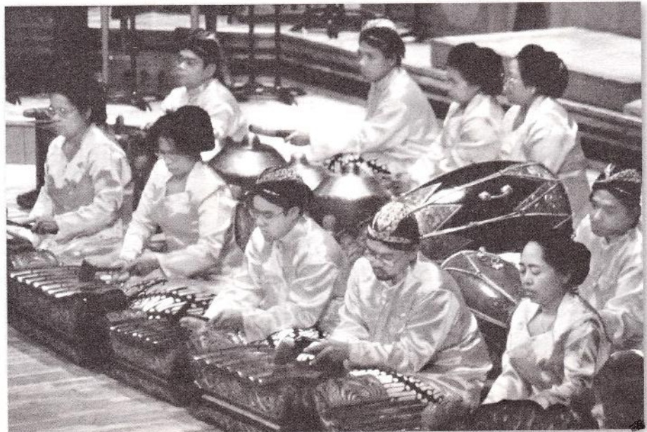
فعالیت موسیقایی مرز جغرافیایی نمی‌شناسد. عکسی از نوازندگان یک گروه گملان (gamelan) (ارکستر موسیقی سنتی اندونزی).

ما به شیوه‌هایی بسیار مختلف موسیقی گوش می‌دهیم. موسیقی می‌تواند به صورت یک صدای پس‌زمینه‌ای کمابیش نامحسوس شنیده شود، یا ما را کاملاً در خود غرق کند. در نخستین بخش این کتاب، با عنوان «عناصر و مبانی موسیقی»، مفاهیمی معرفی می‌شوند که توجه به آن‌ها می‌تواند بر میزان لذت بردن از شنیدن سبک‌های بسیار متنوع موسیقایی مؤثر باشد. برای مثال، هشیاری به رنگ صدا - کیفیتی که صدای سازها را از یکدیگر متمایز می‌کند - می‌تواند لذت شنیدن موسیقی‌ای که در آن اجرای ملودی از کلارینت به ترومپت واگذار می‌شود را افزایش دهد. شنیدن هوشمندانه و هشیارانه‌ی موسیقی تجربه‌ی موسیقایی ما را عمیق‌تر، و رضایت ما از شنیدن موسیقی را بیشتر می‌کند.