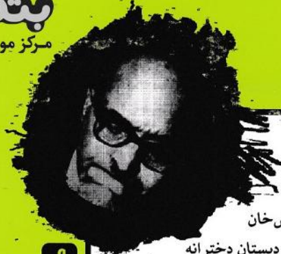
علیهی وزیری (۱۳۵۸-۱۲۶۵)