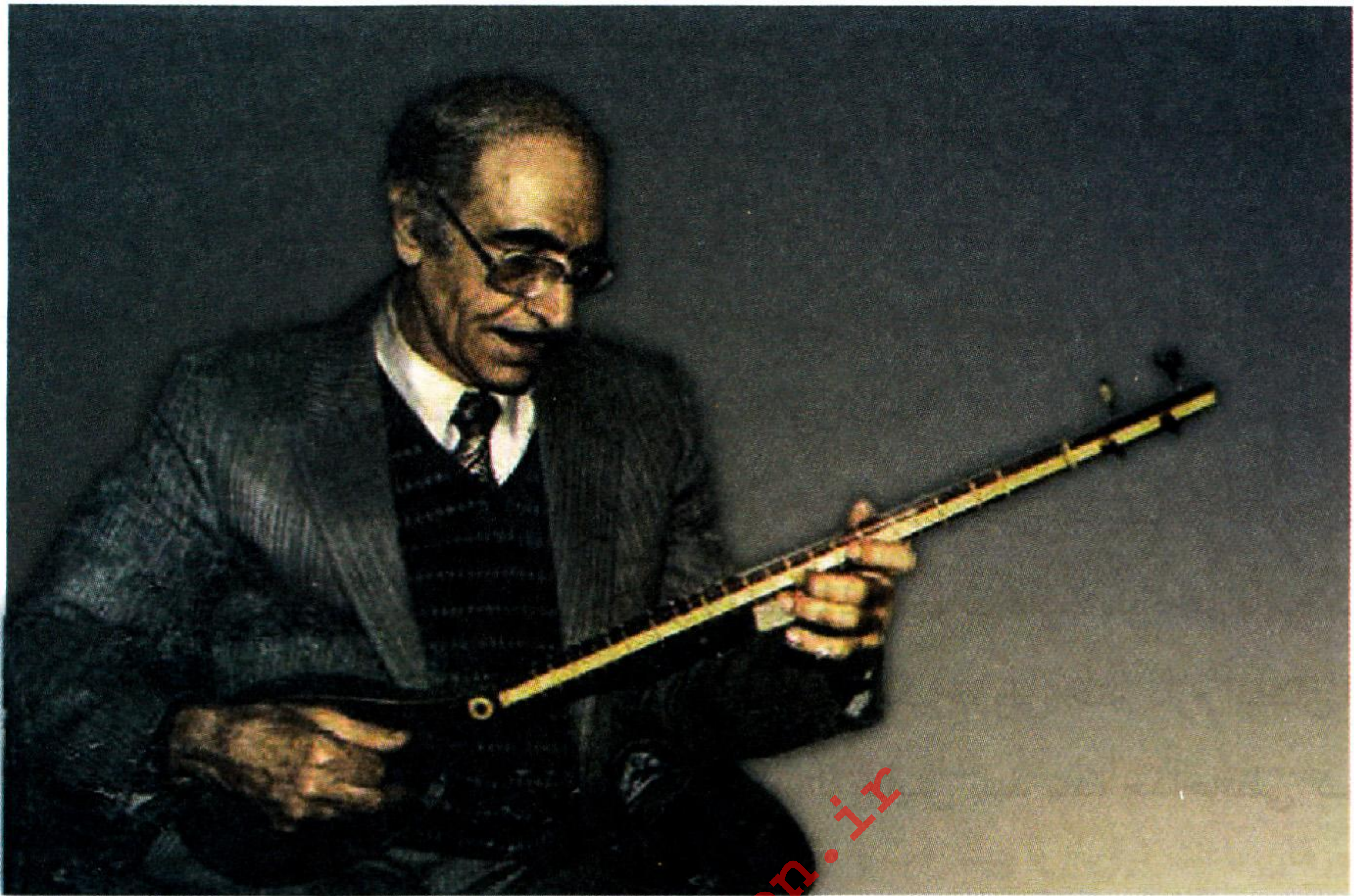
استاد علی تجویدی با سه تار ساخت نگارنده

روزی در خدمت زنده یاد علی تجویدی بودم ایشان از ناملایمات و نارسایی ها و همچنین کم لطفی هایی که در حق موسیقی و اهل آن شده بود، گلّه داشتند، عرض کردم: چه کاری شود کرد؟ به قول زنده یاد استاد تاج اصفهانی همین است که هست. استاد تجویدی در جواب فرمودند: مسئله چیز دیگری است اینها هیچ گاه (بعضی از مسئولین) در حرف زدن کم می آورند. دیروز معاون وزیر وقت فرهنگ و ارشاد اسلامی، دکتر ۰۰۰ آمده بودند منزل، و به من پیشنهاد دادند که ارکستر سازهای ملی را تشکیل دهم و آن را رهبری کنم. به او جواب دادم اولاً تشکیل یک چنین گروهی شوخی نیست و کار هر کسی هم نیست. زحمت می خواهد، بودجه کافی لازم دارد. شوق و ذوق و اشتیاق می خواهد و از همه مهمتر نوازندگان آن باید از نظر مالی تأمین شوند، که ما هیچ کدام از این شرایط را نداریم. درثانی به او گفتم: مگر همین پیشنهاد به آقای حسین دهلوی از طرف وزیر وقت داده نشد؟ مگر او با زحمت، بیش از استاد نوازنده جوان و علاقه مند را دور هم جمع نکرد و مگر با آن همه زحمت و مشقت برنامه اجرا نکرد؟ شما چه حمایتی از آقای دهلوی کردید و چرا باعث شدید گروه به آن بزرگی با آن