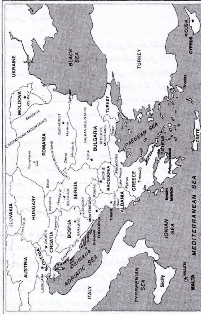
شکل ۱-۱. جنوب شرقی اروپا.