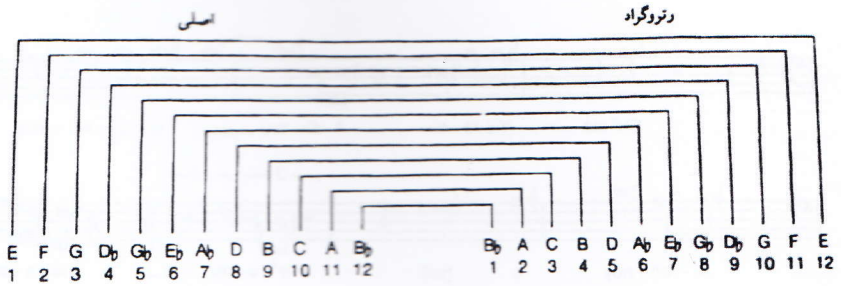
شکل ۳-۲۹: شکل اصلی و رتروگراد یک سری صوتی (کیمی، ۱۳۹۰: ۶۶۹)

«از آن جاکه چهارصد و هفتاد و نه میلیون و هزار و ششصد ترتیب ممکن برای توالی دوازده صدای کروماتیک وجود دارد، قلمرو انتخاب ردیف‌های صوتی در عمل نامحدود است. ردیف صوتی باید با دقت بسیار ساخته شود؛ زیرا تأثیر فراوان بر کیفیت صوتی موسیقی دارد و نیز سرچشمه هر ملودی و آکوردی است که در قطعه ظاهر می‌شود» (کیمی، ۱۳۹۰: ۶۶۸).