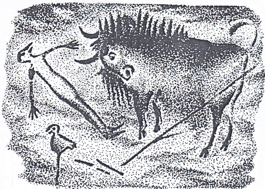
نقاشی داخل غار

اوابتداری دوپایستادن را آموخت، خطرهای روی زمین را شناخت، جمعی زندگی کردن را دریافت، ابزار دفاعی ساخت، محدوده‌ای امن یافت و ضرورت حک تصاویر را روی دیواره‌ی غار حس کرد. انسان بدوی به دلیل ترس از ناشناخته‌ها به سحر و جادو روی آورد که در همه جنبه‌های زندگی او تأثیر گذاشت. شاید جادوگری اولین فانتزی‌های (ذهنیات و تخیلات) انسانی در تاریخ باشد. او در مقابل بلایای طبیعی مثل رعد و برق، سیل و طوفان، آتش سوزی، مبارزه با حیوانات و حتی در ستیز با هم‌نوعان قوی ترش احساس ناتوانی می‌کرد، پس با انجام دادن اعمالی که ابداع کرده بود خودش را قوی می‌ساخت و گاهی هم پیروز می‌شد. در حقیقت، جادو ساخته و پرداخته‌ی ذهن انسانی است. با گذشت زمان، جادوگری دارای مراسمی شد که عزم انسان‌ها را به اجرای اعمالشان راسخ‌تر می‌کرد. به این ترتیب که تأثیر مثبت این مراسم نیروی بیشتری را برای آن‌ها القا می‌کرد و با جسارت بیشتری به کارهای خود می‌پرداختند. پس، انسان ذهنیتی ساخت و آن را بخشی از واقعیت پنداشت، یعنی جادوگری از جریان زندگی جدا نبود، بلکه اساسی واقعی یافته بود و عمل مثبتی در زندگی انسان بدوی محسوب می‌شد. در آن دوره، تصاویر درون غارها همراه با گسترش ذهن جادویی تغییر می‌کرد. در واقع تصاویر واقعی شکار با ذهنیتی غیر واقعی آمیخته شد که ریشه در ساحری داشت و روی دیواره غار نقش بست.