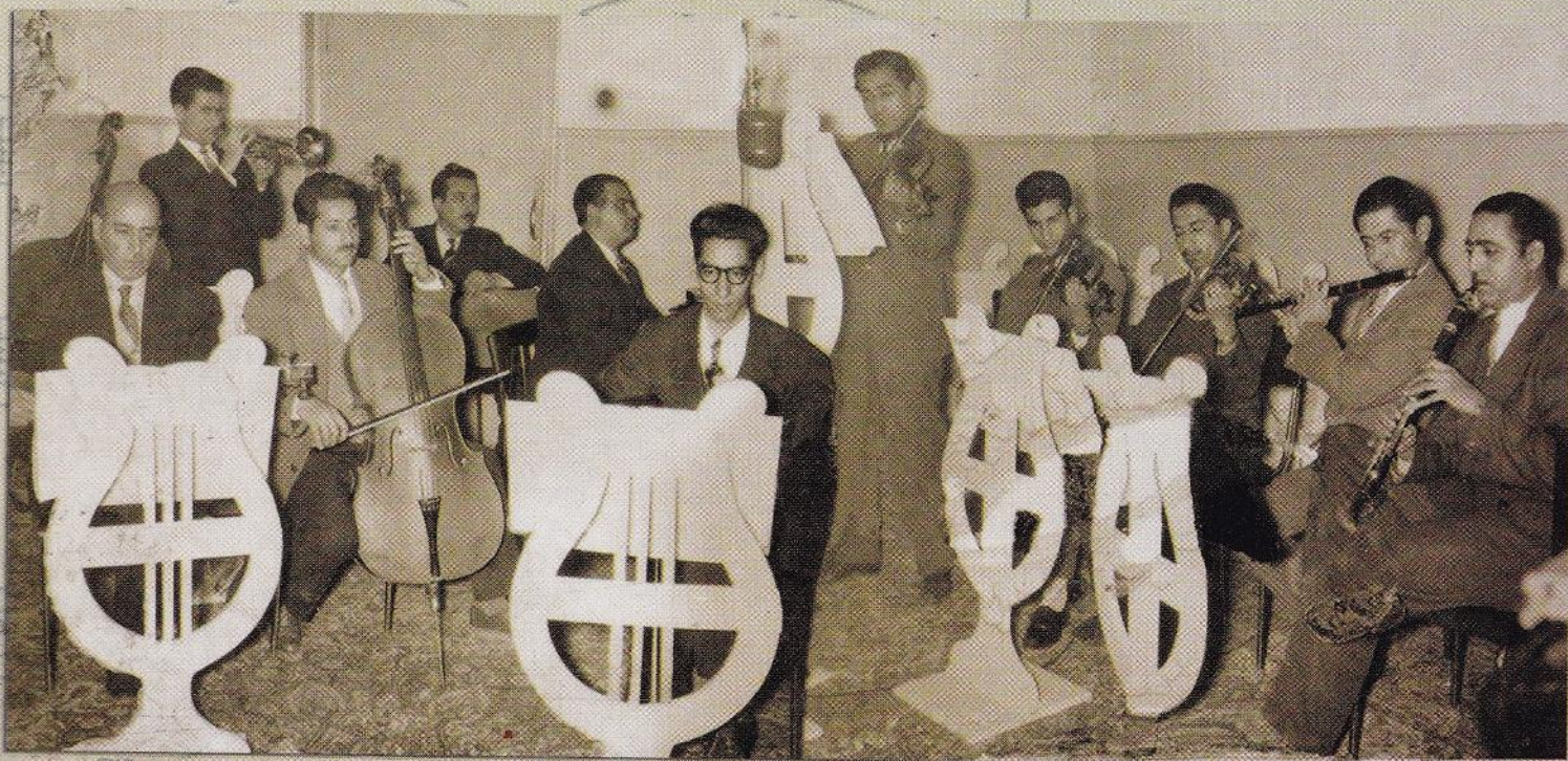
ارکستر بزرگ رادیو ایران ، به رهبری استاد عبدالله جهان پناه