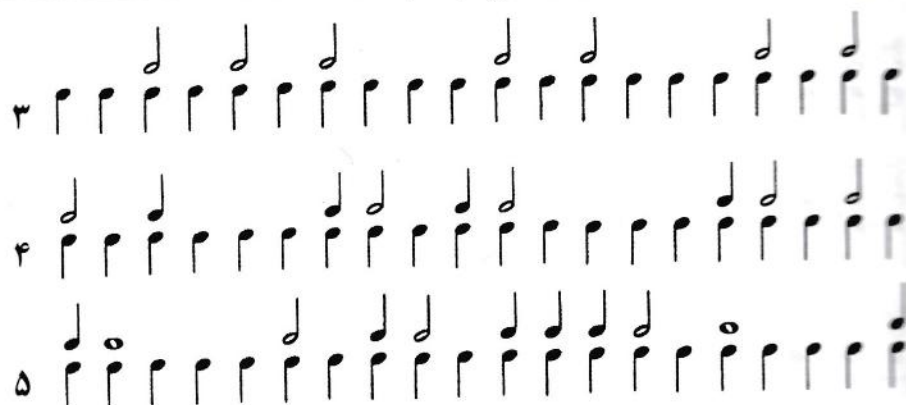
شکل ۶ (ادامه)

تمرین ۳- به همین منوال هرکجا صدا نباشد از شکل سکوت‌ها استفاده می‌کنیم.