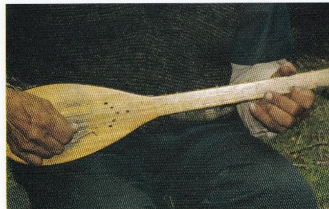
نحوه قرار گرفتن دست‌ها بر روی سازهای مختلف