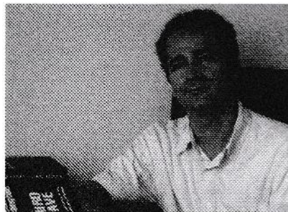
بهمن کاظمی متولد ۱۳۴۵ موسیقی‌شناس اقوام و ملل - مدرس دانشگاه

موسیقی آوازی را از دوران کودکی و موسیقی سازی را از دوران نوجوانی فراگرفت. خانواده پدری‌اش آشنا با خط و ادبیات، و خانواده مادری او از شیفتگان موسیقی سنتی بودند. از این‌رو، وی از همان ابتدا به شنیدن آثار صوتی دوران قاجار روی آورد. در این زمینه، میرعلی مکرمی از دوستان و معاصران اقبال آذر، گنجینه گرانمایی از موسیقی قدیم و روایت متفاوتی از ردیف آوازی را در اختیار وی قرار داد که از دوران نوجوانی چراغ راهش شد.