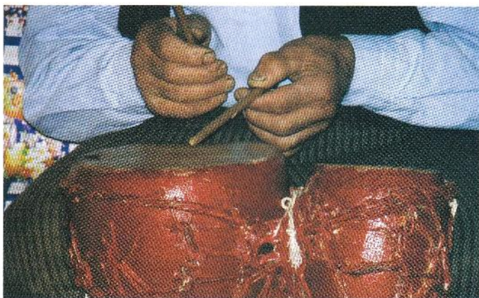
نحوه قرار گرفتن دست‌های بر روی سازهای مختلف