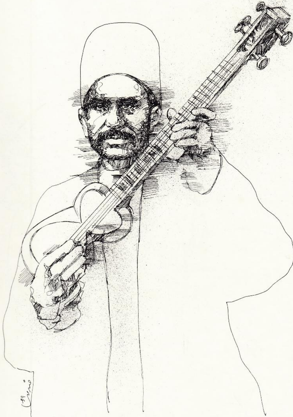
Gholâm-Hossein Player of the Qajâr Period