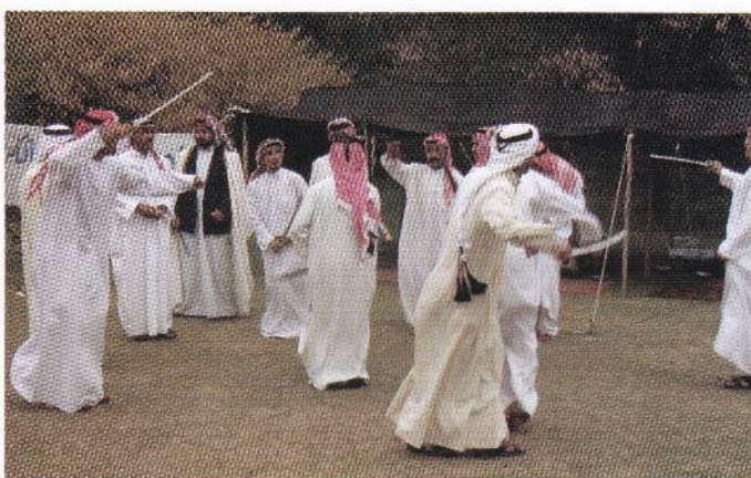
موسیقی شادمانی در میان زنان و مردان عرب