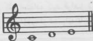
C major: I II III

در ابتدای این فصل خاطر نشان کردیم که دو نوع دیاتونیک داریم؛ ماژور و مینور. واژه مینور یعنی کوچک‌تر و این گام‌ها به این صورت نام‌گذاری شده‌اند، زیرا در گام‌های مینور، فاصله سوم بین اولین تا سومین نت گام، به اندازه نیم‌برده کوچک‌تر از همین فاصله (یعنی بین نت اول تا سوم) در گام ماژور است. در اصطلاح تِرث ۲ اول گام ماژور، بزرگ است و تِرث اول گام مینور، کوچک است.