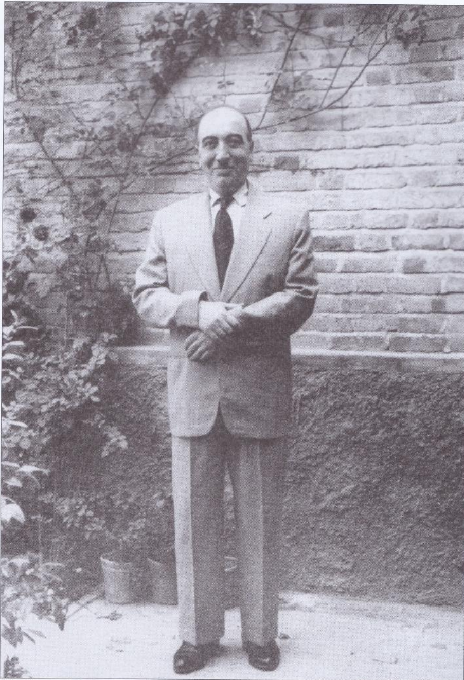
ابوالحسن صبا