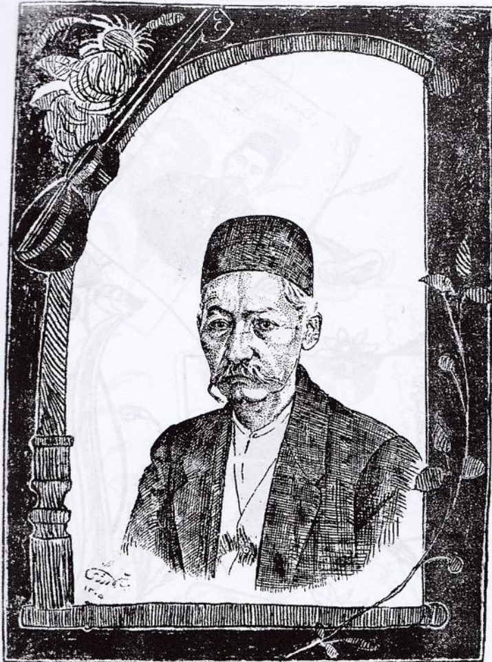
ارتحال غلامحسین خان درویش موسیقی دان شهیر ایران لیلۀ چهارشنبه ۲ آذر ماه ۱۳۰۵ - ۱۳۰۵ ج ۱۸ بی عمارت دل کن که این جهان خراب در آن مرست که از خاک ما بسازد خشت!