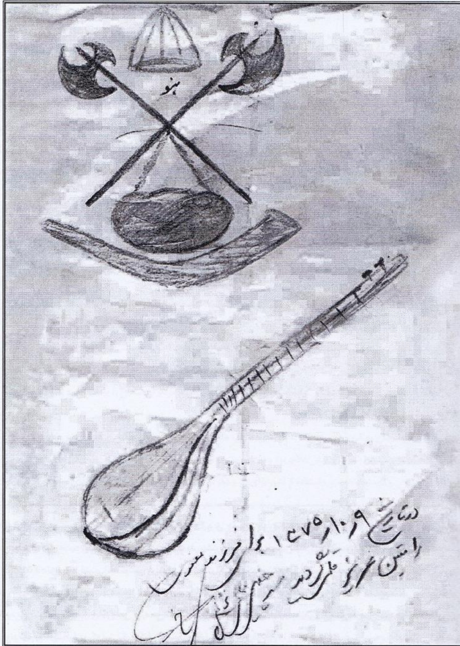
| نقاشی و دست خط سید خلیل عالی نژاد برای رامتین کاکاوندی |