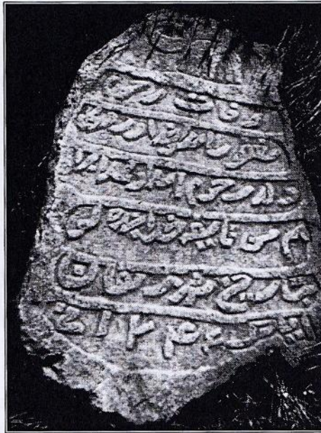
سنگ مزار استاد خداوردی صحنه واقع در روستای پیرسراب |