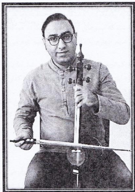
نحوه گرفتن ساز در دست