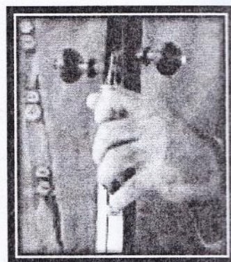
نحوه انگشت گذاری روی ساز