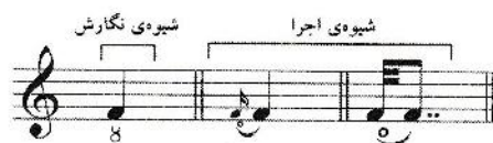
شکل ۷: اجرای کنده

این حالت اجرائی که در ابتدای نغمه روی می‌دهد، با زمان‌بندی درآب (نغمه‌های زینت قبل از زمان نغمه‌ی اصلی) و تقریباً شبیه کمان‌بالا اجرا می‌شود. انگشت دست چپ حرکتی شبیه به کندن سیم دارد (مضرب زدن یا پیتزیکاتوی دست چپ) که تأکید خاصی ایجاد می‌کند به طوری که می‌تواند جایگزین مناسبی برای درآب باشد. برای نمایش این تکنیک از علامت کندن در کتاب‌های تار و سه تار استفاده شده است.