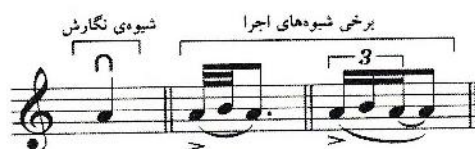
شکل ۲: کمان بالا

کمان بالا کاملاً معکوس کمان پائین است و تمام ویژگی‌های ذکر شده برای کمان پائین را داراست.