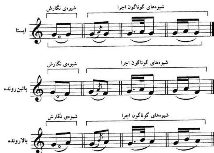
شکل ۴: شیوه‌ی نگارش و اجرای تکیه

زیراین نغمه‌ی تکیه به هر دو نغمه‌ی قبل و بعد از تکیه و حرکت ملودی آن دو نغمه (بالارونده، پائین رونده، ایستا) بستگی دارد. نغمه‌ی تکیه همواره از دو نغمه‌ی اصلی قبل و بعد خود، زیرتر است و در فاصله‌ی دوم از نغمه‌ی زیرتر اجرا می‌شود. آنچه در شکل ۴ ارائه شده شیوه‌ی رایج اجرای تکیه است.