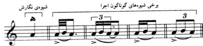
شکل ۳: برخی شیوه‌های گوناگون اجرای ناله

نالِه، که با حرف «ه» نشان داده می‌شود، شبیه کمانِ بالا است، با این تفاوت که در اجرای ناله، هر سه نغمه توسط یک انگشت دست چپ نواخته می‌شوند.