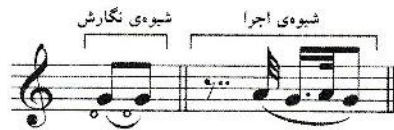
شکل ۶: تکیه در آغاز

تکیه می‌تواند قبل از اولین نغمه در ملودی نیز قرار گیرد. در این صورت، همانطور که در شکل ۶ نشان داده شده، زمان نغمه‌ی تکیه قبل از زمان نت اصلی خواهد بود.