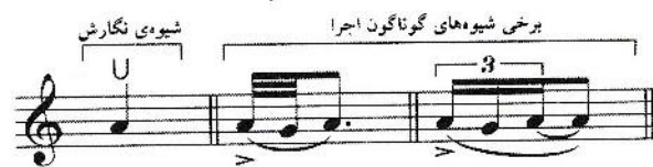
شکل ۱: کمان پائین

کمان پائین تقریباً به گرش تحتانی شباهت دارد با این تفاوت که اولین نغمه در کمان پائین، با تأکید اجرا می‌شود. دو نغمه‌ی دیگر نقش تزئین دارند و با شدت کمتر از نغمه‌ی اول اجرا می‌شوند. این سه نغمه همیشه در یک کمان اجرا می‌شوند. کشش و دیرش دو نغمه‌ی اول قابل تغییر است و به تئندای قطعه و تصمیم نوازنده بستگی دارد.