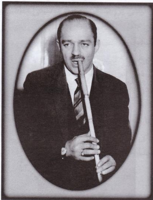
استاد حسن کسایی