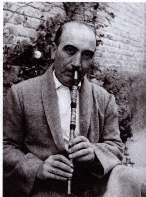
استاد ابوالحسن صبا