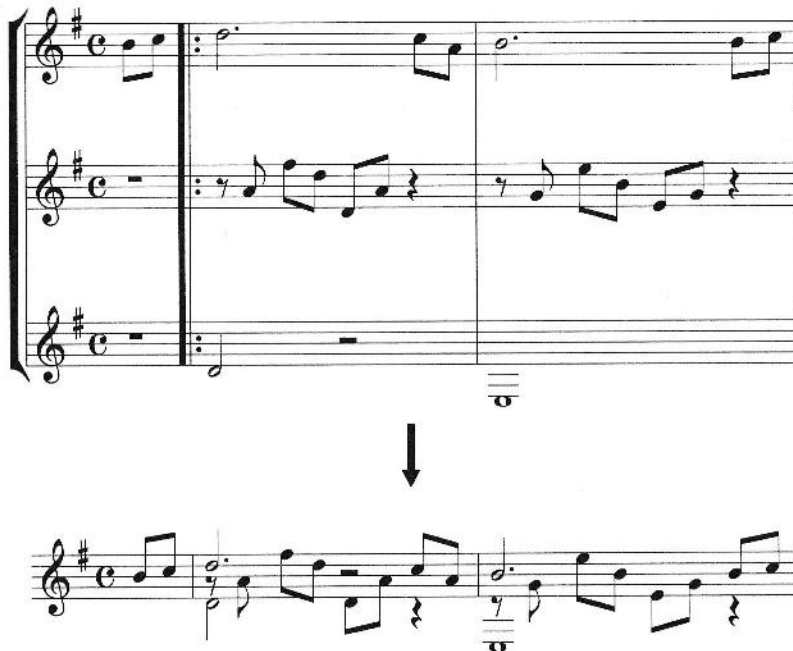
مثال ۲- شکل گیری بافت هموفونیک از یک تریو