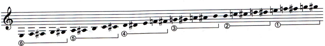
شکل ۱.۴ نت‌های موجود در پوزسیون اول

نکاتی که در مورد پوزسیون‌ها لازم به ذکر است: