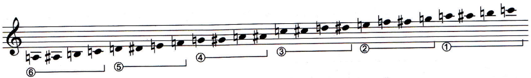
شکل ۱.۳ نت‌های موجود در پوزسیون پنجم

هر چهار باره متوالی بر روی گیتار، یک پوزسیون را تشکیل می‌دهند به طوری که هر گاه انگشت اول در باره پنجم باشد هر یک از انگشتان به ترتیب در باره‌های بعدی قرار می‌گیرند و تشکیل پوزسیون پنجم را می‌دهند. (شکل ۱.۳) پوزسیون اول چون شامل سیم‌های آزاد نیز می‌باشد در نتیجه تعداد نت‌های موجود در این پوزسیون افزایش می‌یابد. این پوزسیون دارای بیشترین کاربرد در آهنگسازی و اجرا می‌باشد. (شکل ۱.۴)