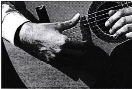
عکس ۱ شروع ضربه به سیم ششم

برای به صدا در آوردن یک سیم با شست، شست را روی آن سیم گذاشته و رو به پایین فشار می دهیم ، بطوریکه پس از به صدا در آمدن آن سیم، شست روی سیم پایینی قرار گیرد. به عنوان مثال برای به صدا در آوردن سیم ششم، شست را روی سیم ششم میگذاریم و با فشار رو به پایین آن را به صدا در میآوریم. در پایان این ضربه، همانطور که در عکس ۲ ملاحظه می کنید، شست روی سیم پنجم قرار میگیرد و به آن تکیه می کند، دقت کنید که هنگام ضربه، شست را خم نکنید.