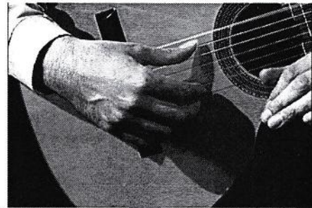
عکس ۲ پایان ضربه که شست پس از ضربه به سیم ششم ، روی سیم پنجم قرار گرفته است

برای این کار با این ضربه آشنا شوید، هر یک از سیمها را چند بار به صدا در آورید.