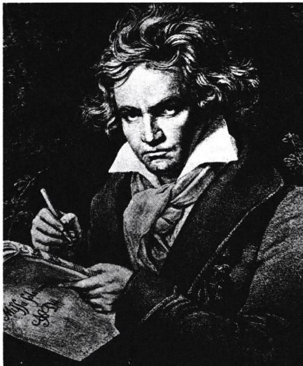
اولین چاپ انگلیسی سونات‌های بتهوون