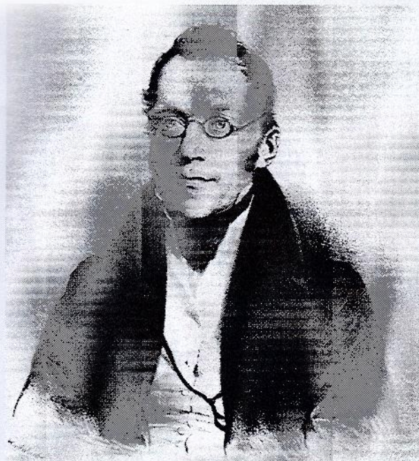
Carl Czerny in 1833 (Lithograph by Kriehuber)