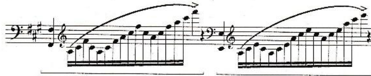
MOZART, Piano Concerto, A minor, K. 488 (From cadenza by Reinecke)