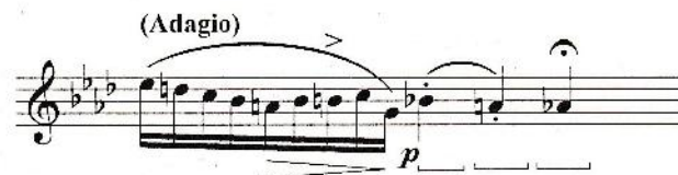
BEETHOVEN, Sonata, Op.27, No. 1