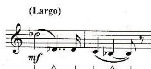
BEETHOVEN, Sonata, Op. 31, No. 2