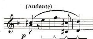
BEETHOVEN, Sonata, Op. 28