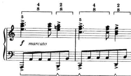
میزان‌های ۳۳ تا ۳۴

این والس سرزنده و شاداب هم از لحاظ هارمونی و هم از لحاظ ریتمیک تم مجارستانی دارد. اجرای آن از لحاظ موسیقی لذت بخش است و سرشار از روح جیپسی است. نوعی از الگوی ۲+۴ با نت چنگ نوشته شده است که به عنوان آماده سازی برای فرود نهایی رخ می‌دهد. میزان‌های ۳۳ تا ۳۴ را مشاهده کنید: