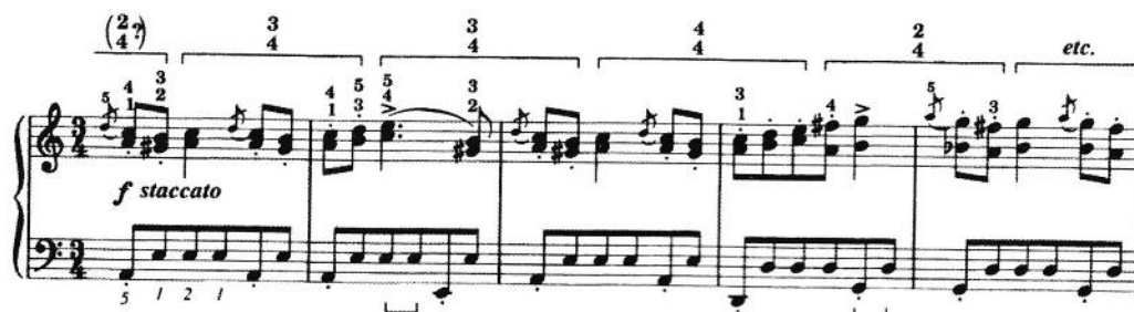
میزان‌های ۱ تا ۵

هم لهجه های کانتر ( تاکید بر بالاترین نت ) و هم لهجه های آگوکیک تغییر در گروه‌های ریتمیک به طور متوالی ایجاد می‌کنند. تنوع ریتمیک در کل والس مشخص شده است.