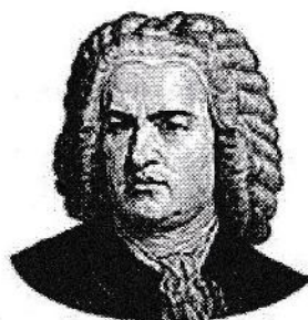
J. S. BACH

تعدادی از این Notenbuchlein ها به خانواده باخ منسوب