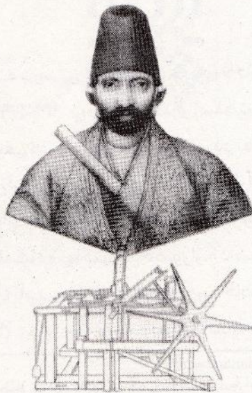
تصویر ۱: چهره‌ی خودنگار صنیع‌الملک و طرح دستگاه ، روزنامه‌ی دولت علییه‌ی ایران ، تاریخ نشر ۱۲۷۷/۲/۱۹ ه. ق، شماره‌ی ۴۷۲، صفحه‌ی ۷.

یکی از این نقاشی‌ها موسوم به علی‌اکبر فرهانی و شاگردانش اثر ابوالحسن غفاری ملقب به صنیع‌الملک و دیگری عمله‌ی طرب اثر محمد غفاری ملقب به کمال‌الملک است. خاندان غفاری یعنی صنیع‌الملک (تصویر ۱)، ابوتراب (برادر بزرگ‌تر کمال‌الملک ) و کمال‌الملک (تصویر ۲)، اهل کاشان و در تاریخ هنرهای تصویری ایران از جایگاه خاصی برخوردار بوده‌اند (پاکباز، ۱۳۸۱: ۴).