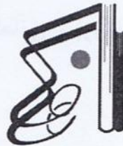
انتشارات موسیقی عارف