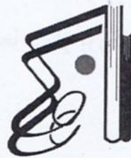
انتشارات موسیقی عارف