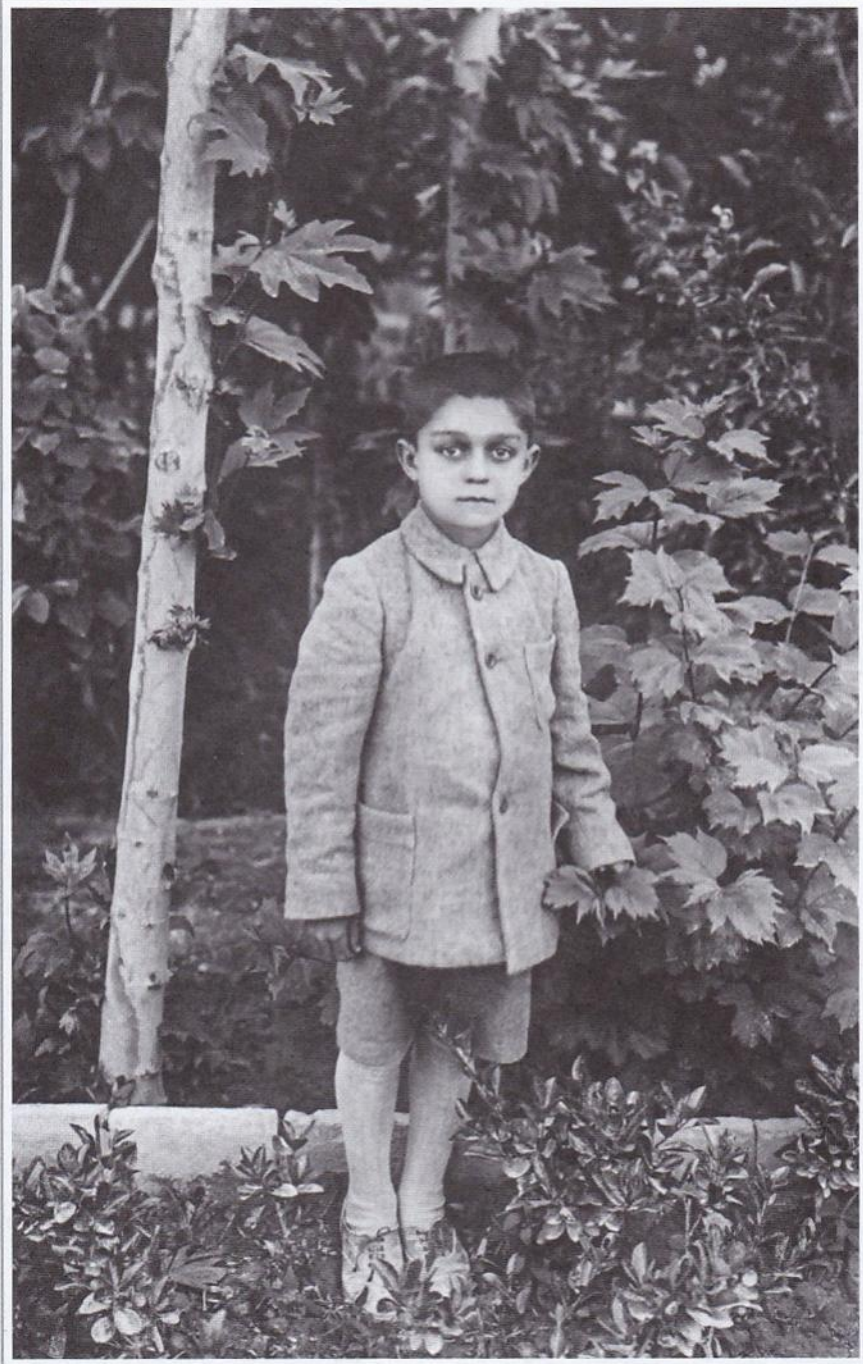
حسن کسایی در کودکی