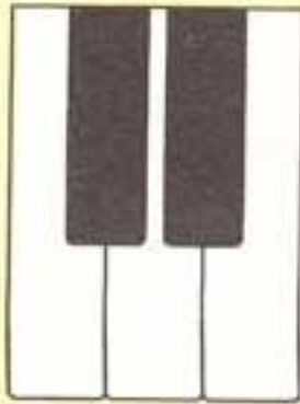
گروه های دوتایی