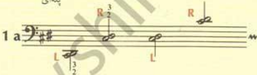
۱. آگردهای خوشه ای پله ای

انگشتان بدون توقف، از پایین به بالا (از بم به زیر) و از بالا به پایین (از زیر به بم) به صورت قوی، ضعیف، کوتاه و بلند و با پدال روی شستی ها حرکت کنند.